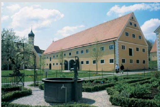
Im Kloster Oberschönenfeld: Blick auf das Volkskundemuseum im ehemaligen Ochsenstall.