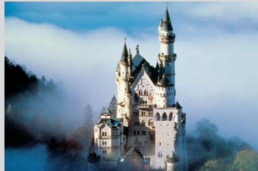
Schloss Neuschwanstein, eine der Perlen der Romantischen Straße.