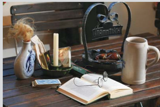
Die Stammtischszene in der Ganghofer-Stätte Welden zeigt eine Facette Ludwig Ganghofers.

Die Dauerausstellung in Welden befindet sich im „Landgasthof zum Hirsch“ (Fuggerstraße 1, Telefon 0 82 93/2 27, www.landgasthofzumhirsch.de , Di – So, 10 – 18 Uhr, Eintritt frei).