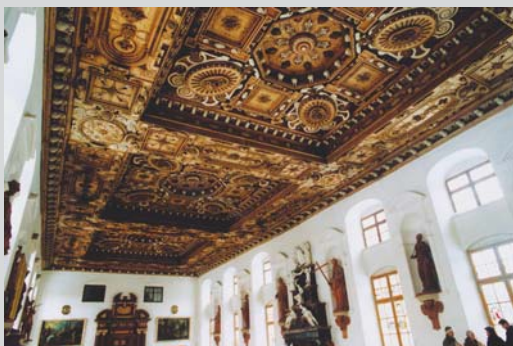
Das Fuggerschloss in Kirchheim an der Mindel.

Leistung: Betreuung durch einen Gästeführer Preis pro Gruppe: € 205,- zzgl. Eintritt Schloss Kirchheim und Babenhausen € 5,- p.P., Fuggerei € 3,- p.P. Dauer: Ganztagestour