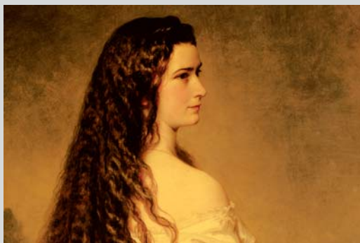
Elisabeth von Österreich galt als schönste Frau Europas. In Unterwittelsbach besucht man ein Schloss ihrer Kindheitstage.

Leistung: Betreuung durch einen Gästeführer Preis pro Gruppe: € 205,- zzgl. Eintritt in die Sonderausstellung im Schloss Unterwittelsbach Dauer: 5 Stunden