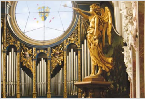
Der Friedensengel auf der Kanzel der Annakirche, einer der bedeutendsten deutschen Lutherstätten.

Augsburg ist die Stadt der „Confessio Augustana“, ein Bischofssitz und Sitz einer jüdischen Gemeinde: Touren führen hier zu Stätten des Glaubens. Und: Augsburg feiert mit seinem weltweit einzigartigen Festtag den Frieden zwischen den Konfessionen.