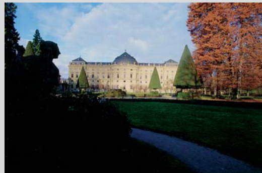
Die Würzburger Residenz sieht man in der nördlichsten Station der Romantischen Straße.

Die Südtour entlang der Romantischen Straße mit Blick auf die Kette der bayerischen Alpen: Augsburg – Landsberg – Schongau – Wieskirche – Füssen und die Königsschlösser Neuschwanstein und Hohenschwangau am Forggensee.