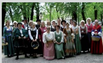
Unser Gästeführer-Team überrascht mit einer Vielzahl unterschiedlichster Incentives.

Dauer: 2 Stunden Führung oder 2 Stunden Abendprogramm