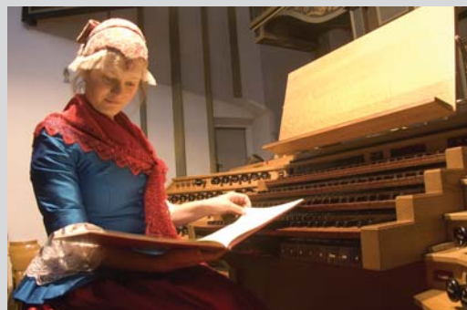
Mit dem Augsburger „Bäsle“ erlebte Mozart sein erstes erotisches Abenteuer – ein Thema bei allen Führungen durch die Mozartstadt.

Literatur: Das Reisetaschenbuch „W.A. Mozart und Augsburg: Vorfahren, Vaterstadt und erste Liebe“ führt auch in den Mozartwinkel.