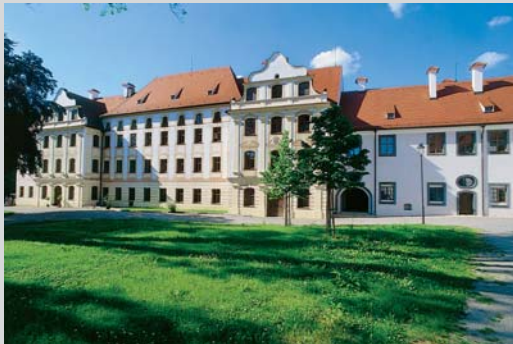
Eines der bayerischen Urklöster – das (heute barocke) Kloster Thierhaupten.

Im Augsburger Umland finden Sie Perlen des bayerischen Barock, bekannte Wallfahrtskirchen und viel besuchte Klöster (mit beliebten Biergärten und Klosterwirtschaften) – „Pilgerfahrten“ zu Glaubensstätten, Bau- und Braukunst.