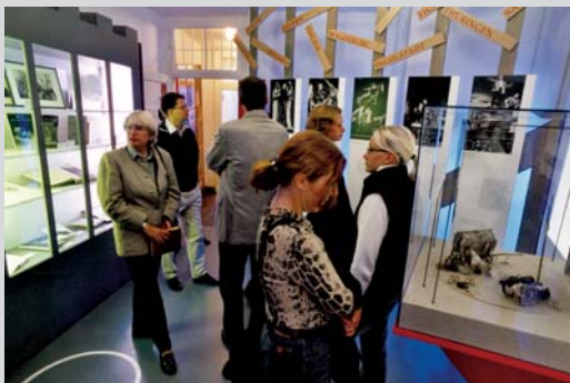
Wissenswertes zu Bertolt Brecht, seiner Augsburger Kindheit und Jugend und zu seinem bewegten Leben erfahren Besucher des Museums im Brechthaus.