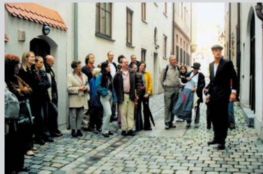
Bertolt Brecht – verkörpert durch einen Schauspieler – führt durch seine Stadt.