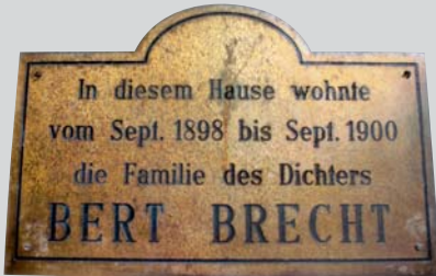
In drei Augsburger Häusern lebte Bert Brecht während seiner Kinder- und Jugendzeit in der Stadt.