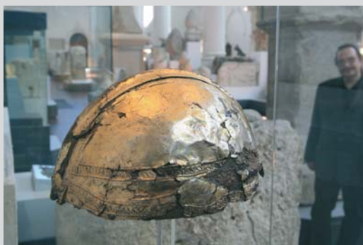
Ein Exponat im Römischen Museum – der vergoldete Helm eines römischen Offiziers.