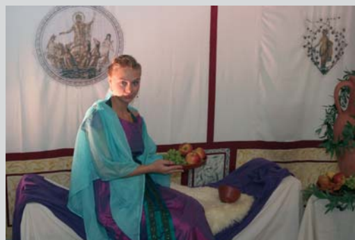
Genuss à la „Imperium Romanum“ im Hotel an der alten Römerstraße Via Claudia Augusta.

Das Hotel Alpenhof und ARTinvent bieten zudem einen römischen Thermentag an.