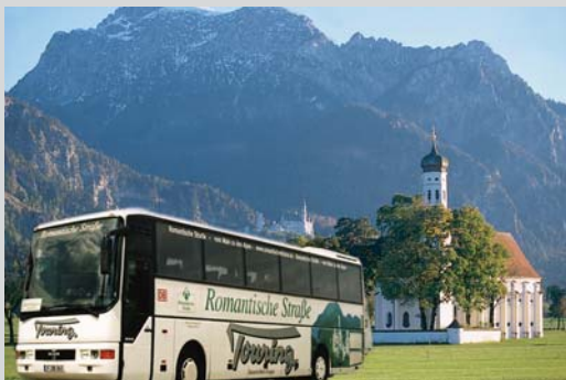
Mit der Europabuslinie zu den Alpen oder an den Main: Die Deutsche Touring fährt alle Stationen der Romantischen Straße an.

www.touring-travel.eu , incoming@touring-travel.eu