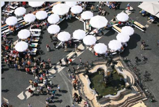
Ihr Friedenfest feiern die Augsburger unter anderem mit einer großen Friedenstafel vor dem Augsburger Rathaus.

Leistung: Stadtführung Preis pro Gruppe: € 80,- zzgl. Eintritte Dauer: 2 Stunden