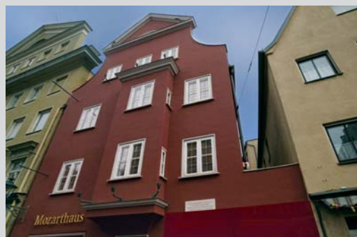
Im Augsburger Mozarthaus wurde 1719 Leopold Mozart, der Vater, Erzieher und Musiklehrer von Wolfgang Amadé, geboren.

– Mozarthaus und Garten für Feiern bis 30 Personen: Miete ohne Programm € 200,- pro Abend