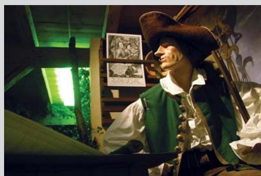
Die Erlebniswelt des „Bayerischen Hiasl“ auf Gut Mergenthau zeigt mit acht Stationen das Leben und Sterben des Wilderers und Räuberhauptmanns Matthäus Klostermayr.